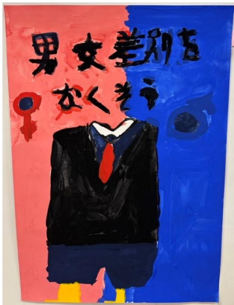
作品名:男女差別をなくそう