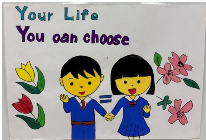
作品名:あなたの人生、あなたが選 ことができる