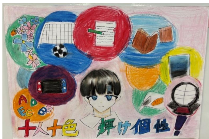
作品名:十人十色<輝け個性!>

男女平等を表すために、イコールのマークを平等を表す青色で書きました。アベリア&チューリップの花言葉が平等なのでそれを描きました。