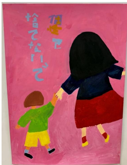
作品名:個性をこわさないで