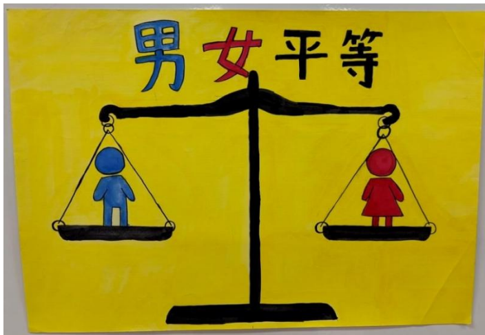
作品名:男女を平等に