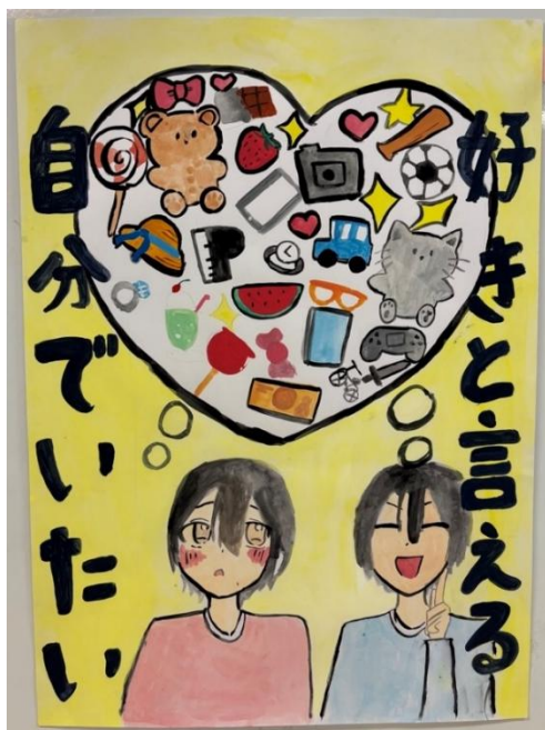
作品名:好きな物を好きと言える自分

平等ということを伝えるために、てんびんを用いました。男女が分かるように赤と青にしました。