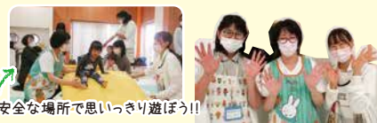
安全な場所で思いっきり遊ぼう!!