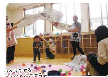
ワクワクするあそびを企画するよ

発達気になるお子さんたちが体の上手なつかいかたを身につけたり、コミュニケーションの力を高めたりしていただけるよう、小集団保育と個別指導を提供しています。言語療法士、作業療法士、公認心理師、保育士、社会福祉士などが専門性を活かして、お子さんの発達をお手伝いします。