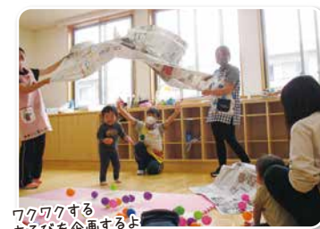
ワクワクするあそびを企画するよ

発達の気になるお子さんたちが体の上手なつかいかたを身につけたり、コミュニケーションの力を高めたりしていただけるよう、小集団保育と個別指導を提供しています。言語療法士、作業療法士、公認心理師、保育士、社会福祉士などが専門性を活かして、お子さんの発育をお手伝いします。