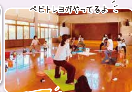
ベビトレヨがやっていると