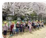
さくらを見に出かけよう!