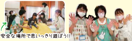
安全な場所で思いっきり遊ぼう!!