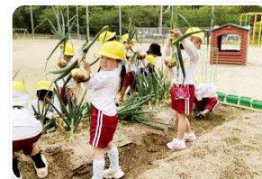
おいしい野菜がとれたよ

木のぬもりが感じられる園舎、体をしっかり動かして遊べる広い園庭。米や野菜・花などが育てられる田んぼや畑、栽培物を調理してもらえ調理場と恵まれた環境にあり、小規模保育所が隣接されている三木町唯一の幼稚園です。保育者は、一人一人の子どものペースや興味関心に寄り添い、子どもの主体性を大切に、個々の力をしっかりと引き出せる幼児教育を行っています。是非、見学や未就園児学級に来てください!!お待ちしております♪