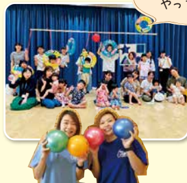
夏まつりもやっていると