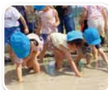
お米ができるかな~