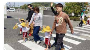
みんなで交通安全!