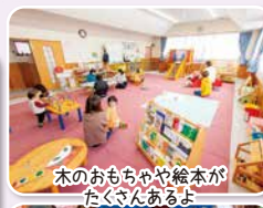
木のおもちゃや絵本がたくさんあるよ