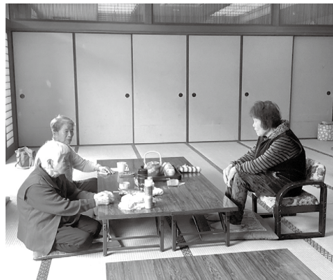
▲居場所の継続を願う人々

地域の居場所として、教養娯楽、福祉相談、貸館、地域子ども生活支援事業などで活用する予定である。