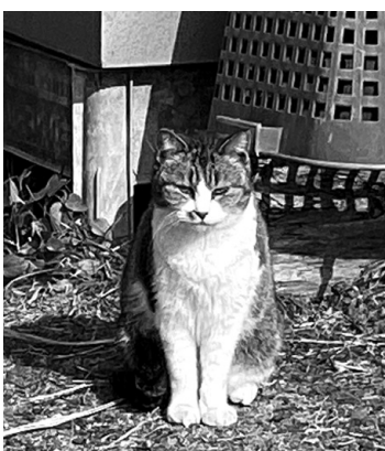
▲みんな仲良く暮らせるように

県の3か年集中対策に合わせて実施。1頭1万円を上限に補助し、昨年は18件実施した。