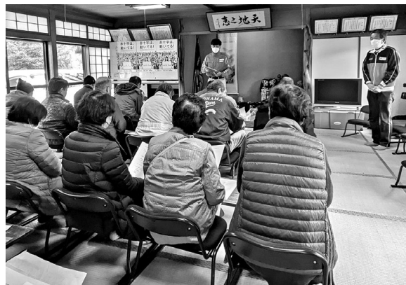
▲南山田地区の自主防災訓練

1組織2万円限度の補助金で、112万円を見越していたが、実績が7組織であったため。