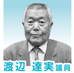
渡辺 達実 議員

三木町総合計画に基づく取組を着実に進めていく。社会保障関係費の増加、資源価格や人件費の高騰による経常経費の増加に加え、大規模な建設事業に取り組んでいることもあり、基金に依存せざるを得ない非常に厳しい状況に置かれている。