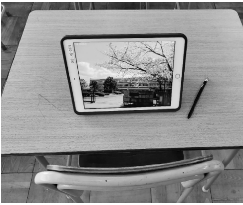
▲更新されるタブレット

5年毎の更新で、今回は国の補助を活用するが、5年後は不明。今回不要になる約2000台の端末をデータ削除処理後、一台3000円で売却処分する予定である。