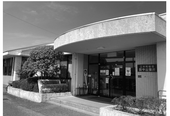
▲公共施設使用料徴収の影響はいかに!?