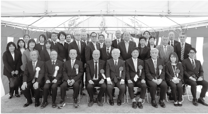
▲こども園安全祈願祭