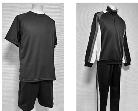
夏用 ▲新体操服 冬用