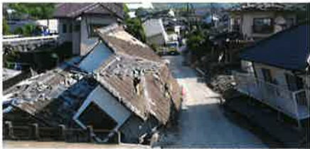
地震の揺れにより住宅が倒壊し、あなたや家族、ご近所さんが下敷きになったら？