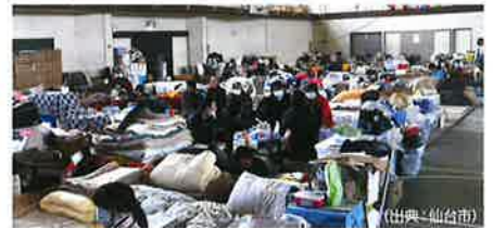
避難所生活をせないかかも！？