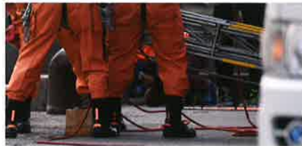
倒壊した建物のガレキで、救急車や消防車が通れなくなってしまったら？