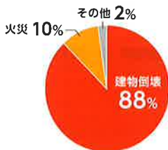
阪神・淡路大震災 ※1

大きな地震で命を失う原因は、建物・住宅の倒壊です。阪神・淡路大震災では、多くの方が建物・住宅の倒壊、家具の下敷きによる圧死・窒息死が原因で亡くなっています。