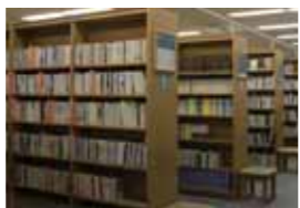
情報資料室(メタ・ライブラリー) メタホール