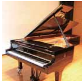
スタインウェイピアノ

三木町文化交流プラザは、優れた芸術・文化に触れる機会を提供する目的で平成9年3月に建設され、世界の名器スタインウェイピアノを配備している800席のメタホールをはじめ、200席の小ホールや6万冊の図書などが揃う情報資料室などを有し、文字どおり文化創造の拠点施設として人々が集まり、交流できる施設として広く利用されています。