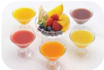
マンナンスムージー