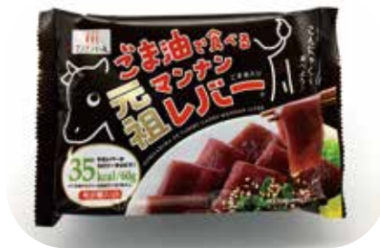
レバ刺し風こんにやく 元祖マンナンレバー

見た目のユニークさは話のネタに最適。こんにやくと思えないほどレバ刺しの味わい、食感に近く、なおかつ低カロリー。